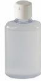
Flaconcino di gel igienizzante

Durante tutte le fasi di spostamento all'interno della scuola, lo studente dovrà indossare la mascherina di protezione, che potrà togliere unicamente se seduto al proprio banco e/o nel posto mensa.