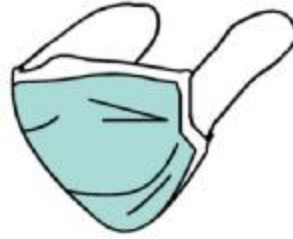
Mascherina di protezione di naso e bocca