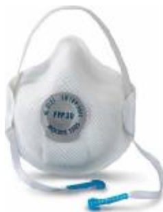
Semimaschera filtrante con valvola di esalazione

Lo scopo di tali dispositivi è principalmente quello di proteggere chi le indossa.