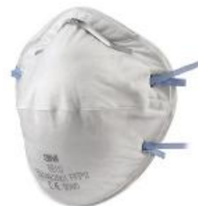
Semimaschera filtrante senza valvola di esalazione