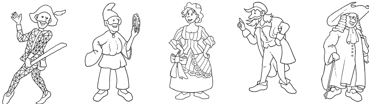
ARLECCHINO PULCINELLA COLOMBINA PANTALONE BALANZONE

DOPO AVER CONOSCIUTO CINQUE MASCHERE DELLA TRADIZIONE ITALIANA, ABBIAMO REALIZZATO INSIEME I NOSTRI COSTUMI: