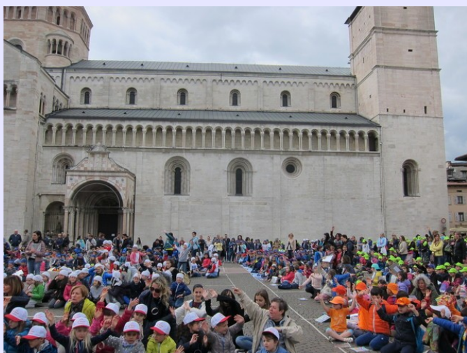
Giunti in Piazza Duomo ci sistemiamo negli spazi predefiniti