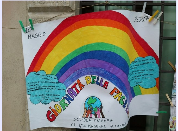
I bellissimo cartelloni esposti in via Belenzani