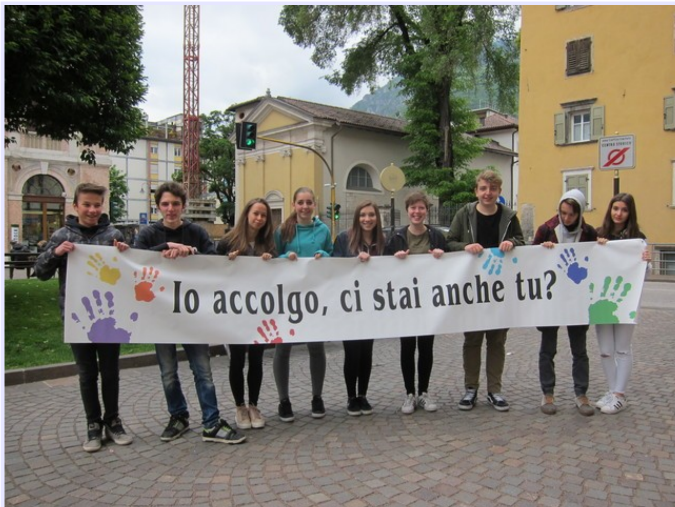
Lo striscione con il motto dell'I.C. Trento 6 realizzato dagli studenti dell'Isituto Pavoniano Artigianelli di Trento