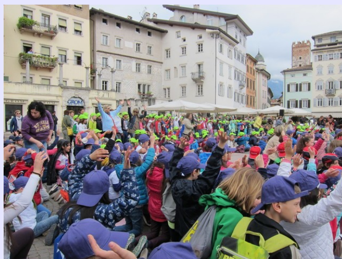
La festa è piena di canti e danze, e termina con uno scambio di doni fra scuole