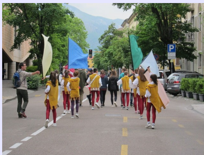
Il corteo si dirige verso Via Verdi