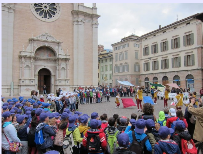
Gli sbandieratori in Piazza S. Maria

Anche quest'anno le scuole Schmid e Cadine dell'Istituto Comprensivo Trento 6, caratterizzate dal consueto colore viola, hanno partecipato in Piazza Duomo alla Giornata della Pace. Più di 1500 gli studenti partecipanti.