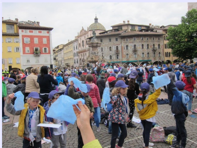
Il racconto dei due amici separati dal mare